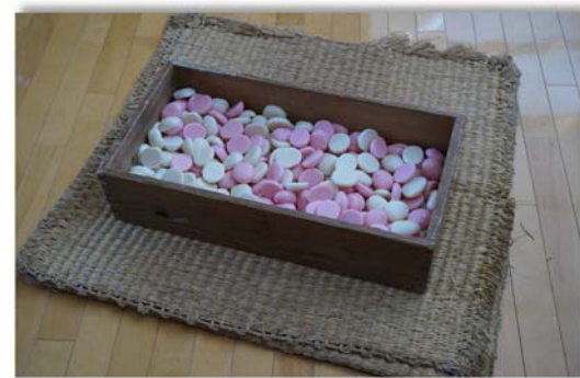
副餅もいただきました