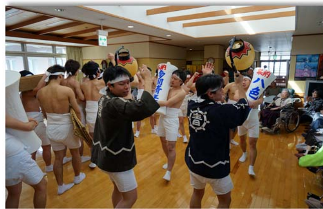
若い衆から元気をもらいました サンヨ～サンヨ!

◎3月2日(月) 多聞青年団来園(写真)・毎年恒例です。入居者の皆さんと職員に元気をくれました。